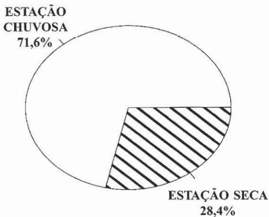
Figura 3. Número percentual de machos de Euglossinae atraídos por iscas-odoríferas nas estações seca e chuvosa, em Barreirinhas, MA, Brasil.