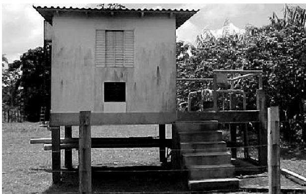
Figura 3 – Abrigo de proteção para equipamentos elétricos do poço tubular na vazante. Comunidade de Santo Antônio. Município de Uruará - AM. Brasil.

Na área estudada, ocorrem diversos mananciais de superfície como paranás, igarapés, lagos, além do próprio rio Amazonas. O