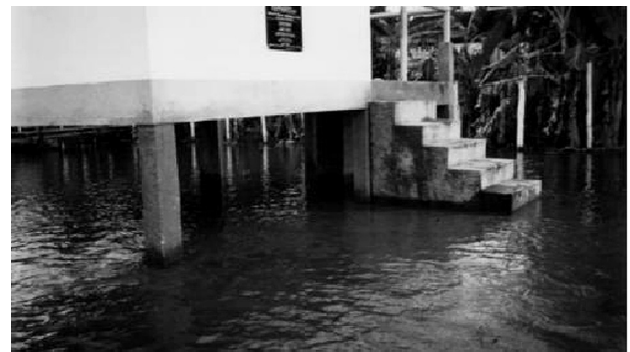
Figura 4 – Abrigo de proteção para equipamentos elétricos do poço tubular na cheia. Comunidade de Santo Antônio. Município de Uruará - AM. Brasil.

Verifica-se que esses valores estão coerentes aos descritos na Tabela 1, exceto a cor aparente expressa em unidade de Hazen (mg/L Pt-Co) que apresentou um grande discrepância nos dois períodos estudados. Em sistemas públicos de abastecimento de água, a cor é esteticamente indesejada para o consumidor, e pode ter origem mineral ou vegetal, causadas por substâncias metálicas como o ferro e o manganês (comuns nas águas do rio Amazonas), matérias húmicas, algas, plantas aquática e protozoários.